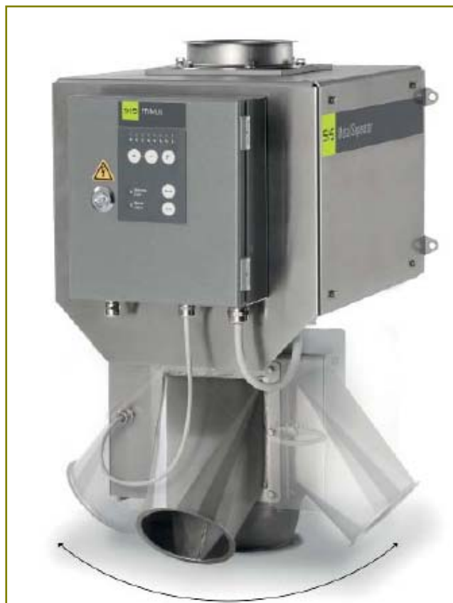
(με περιστρεφόμενη μονάδα διαχωρισμού*)

Ανιχνευτής και Διαχωριστής μετάλλων για εφαρμογές κάθετης ροής υλικού