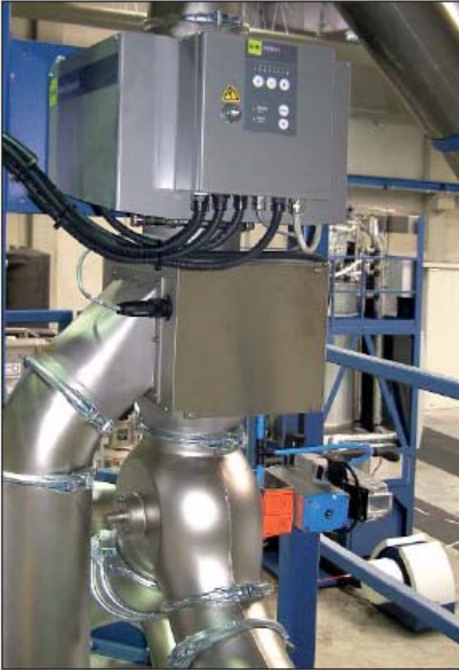
Διαχωριστής μετάλλων RAPID Vario-FS που χρησιμοποιείται για τον έλεγχο της ποιότητας του αναγεννημένου PET